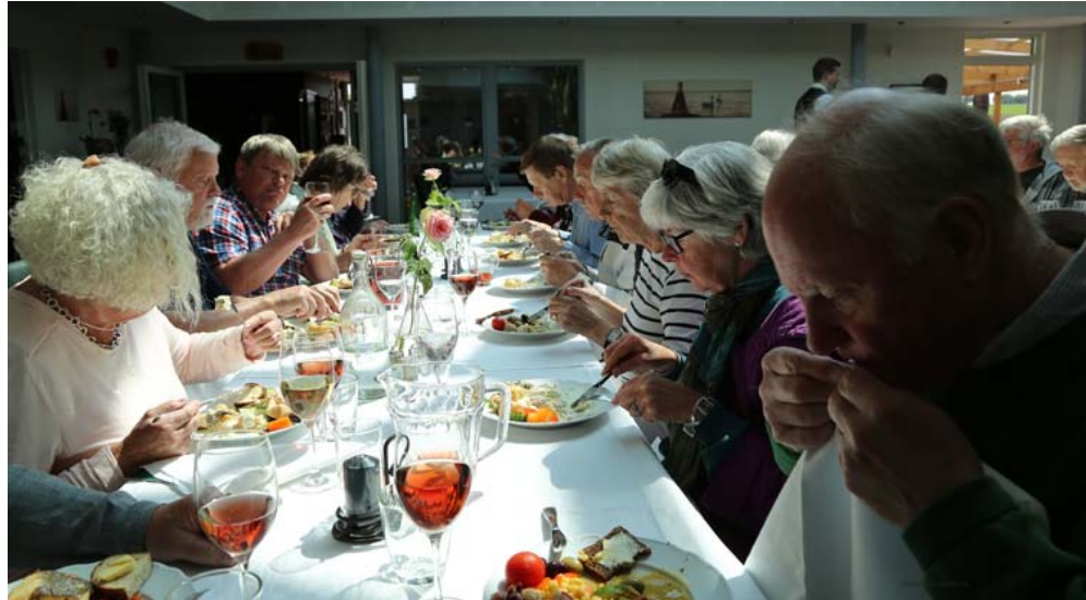
Från en lunch på Ven i glada vänners sällskap.