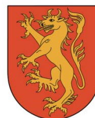
Skånska Akademien Kultur och Humor

Mars, Årsmöte Vänföreningen Akademiens Årsfest på Grand Hotel. Övrigt i programmet, informerar vi separat och i kommande nyhetsblad. Glöm inte att följa oss på hemsidan och på våra Facebooksidor.